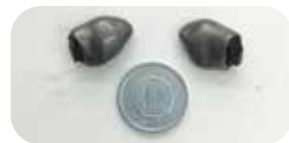
▲ご使用の補聴器 フオナック社製パート B90 チタン